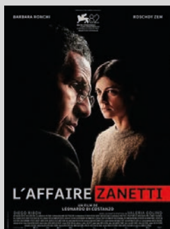
L'AFFAIRE ZANETTI de L. DI COSTANZO / Italie