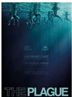
THE PLAGUE de C. POLINGER / USA VOSTFR

Le film comporte quelques dialogues en italien sous-titrés français.