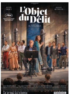
L'OBJET DU DÉLIT de A. JAOUI / France

Tous publics avec avertissement : « La tension et la violence sur les animaux, comme l'évocation du trafic criminel de familles de migrants et de la mort de certains d'entre eux, sont susceptibles de surprendre et de heurter un public sensible non averti ».