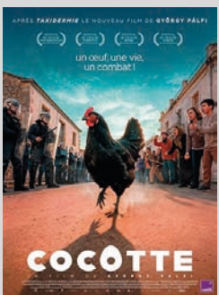
COCOTTE de G. PÁLFI / Hongrie VOSTFR

À grand pouvoir, grandes responsabilités - mais si l'héroïne était une poule ? Sa quête, tendre et ironique, résonne avec les combats silencieux et petits arrangements de la vie humaine.