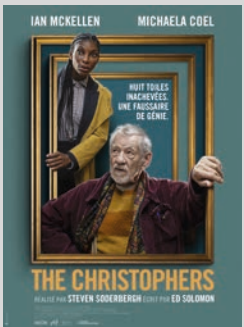
THE CHRISTOPHERS de S. SODERBERGH / USA VOSTFR