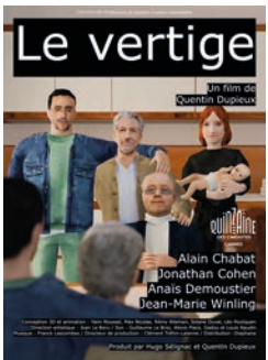
LE VERTIGE de Q. DUPIEUX / France

SÉLECTION OFFICIELLE FESTIVAL DE CANNES 2026