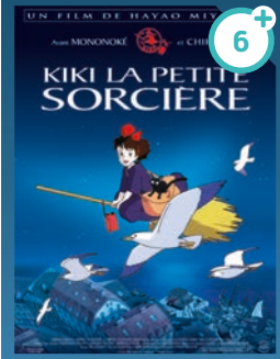
KIKI LA PETITE SORCIÈRE de H. MIYAZAKI / Japon VF VOSTFR

Chez Kiki, treize ans, on est sorcière de mère en fille. Mais pour avoir droit à ce titre, Kiki doit faire son apprentissage : elle doit quitter les siens pendant un an et leur prouver qu'elle peut vivre en toute indépendance dans une ville de son choix.